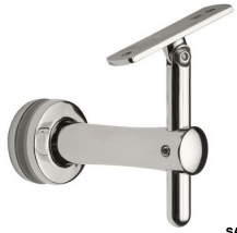
SA - 423 (BG - FLAT)